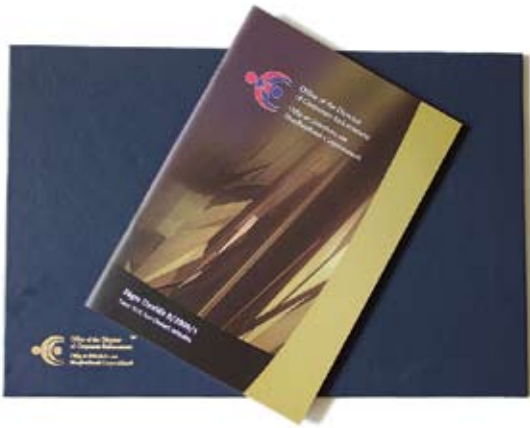
Fógra Cinnidh D/2006/1 arna eisiúint in mí na Samhna 2006

Ag deireadh na bliana bhí an tAire ag breithniú na moltaí a leanas 3 . Beidh fonn freisin ar an Aire i gcomhchomhairle leis an Rialtóir Airgeadais agus leis na Coimisinéirí Ioncaim (más cuí), a bhreithniú más ceart aicmí breise cuideachtaí nó gnóthas seirbhísí airgeadais rialaithe de réir bhrí Airteagal 41(6) den Threoir a bheith díolmhaithe.