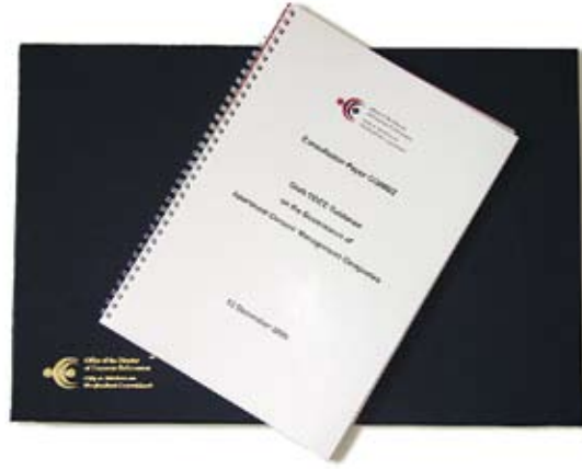
Páipéar Comhairliúcháin faoi Chuideachtaí Bainistíochta Úinéirí Árasáin, arna eisiúint le haghaidh tuairimí i mí na Nollag 2006

Bhí Dréacht-Treoir faoi Rialachas Cuideachtaí Bainistíochta Úinéirí Árasáin (CBUA) folaithe leis an dara Páipéar Comhairliúcháin OSFC arna eisiúint i 2006 4 . Is mar fhreagairt ar cheisteanna agus ar thuairiscí a fuair an Oifig maidir leis an ábhar agus a raibh a líon ag dul i méid i gcónaí a ullmhaíodh an Treoir seo. Ba léir easpa eolais maidir le ceanglais dlí cuideachta ag stiúrthóirí agus ag comhaltaí dá leithéidí de chuideachtaí (.i. úinéirí árasáin). Iarracht a bhí sa Pháipéar Comhairliúcháin agus sa Dréacht-Treoir eolas maidir le sárchleachtas rialachais a sholáthar dóibh siúd a bhí bainteach le cuideachtaí bainistíochta d'fhonn feidhmíocht chuideachta a fheabhsú in imeacht ama. Tharraing an Páipéar Comhairliúcháin aird shuntasach ó na meáin tráth ar lainseáladh é i mí na Nollag 2007, agus tar éis na tuairimí a tháinig isteach a chur san áireamh, bheartaigh an Oifig Treoir leagan deireanach den Treoir a fhoilsiú níos deireanaí i 2007.