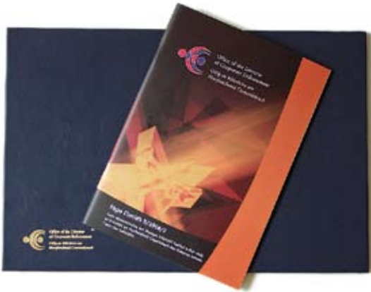
Fógra Cinnidh D/2006/2 arna eisiúint i mí na Nollag 2006