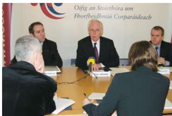
An Stiúrthóir agus beirt dá ball foirne os comhair an phreasa ag seoladh Páipéar Comhairliúcháin OSFC faoi Rialachas Cuideachtaí Bainistíocht Úinéirí Árasáin.

Bhí tarraingt arís eile ar shuíomh idirlín nua na hOifige ag www.odce.ie ag cuairteoirí ar spéis dóibh cúrsaí rialachais chorparáidigh agus a bhfuil a líon ag dul i méid i gcónaí. Tugadh 243,914 chuairt ar an suíomh, ardú de 36% ar na 178,904 chuairt i 2005 (arbh ardú é féin de 53% ar an bhfigiúr de 116,783 i 2004). Taispeánann an chairt thíos líon na gcuirteanna in aghaidh na míosa agus is léir uaithe go raibh an trácht i ngach mí i 2006 thar mar a bhí sa mhí choibhéise i 2005. Ba iad mí Márta agus mí na Nollag na míonna is gnóthaí don suíomh.