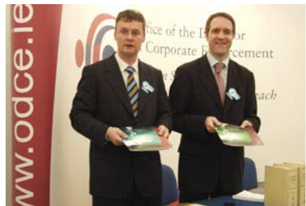
Beirt bhall foirne an Stiúrthóra réidh le faisnéis a thabhairt ag an Craobhchomórtas Treafa Náisiúnta.

Déanann Coiste Bainistíochta na hOifige ionadaíocht ar son na foirne ar fad agus bhí cruinnithe rialta aige i 2006 faoi chathaoirleacht an Stiúrthóra chun déileáil le ceisteanna polasáí agus eagraíochtúla a dhéanfaidh difear d'fhorbairt leanúnach na hOifige.